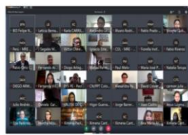
Imagen 2. Reuniones y diálogos Grupo de Infraestructura