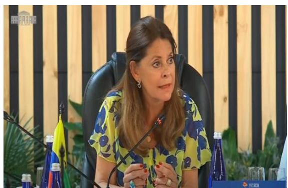
VICEPRESIDENTE CANCELLER COLOMBIA

En su intervención el Presidente Mario Abdo destacó la importancia del Foro como "garantía de equilibrio que necesita la región". También manifestó que la meta será lograr compaginar los intereses de las ocho naciones integrantes en acciones concretas que traigan resultados a los países. Leer +