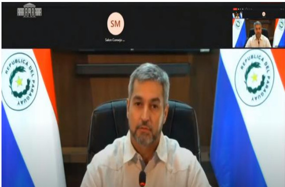
PRESIDENTE DEL PARAGUAY